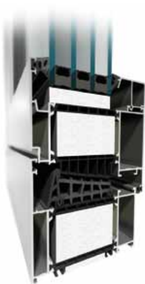
MB-104 Passive Aero